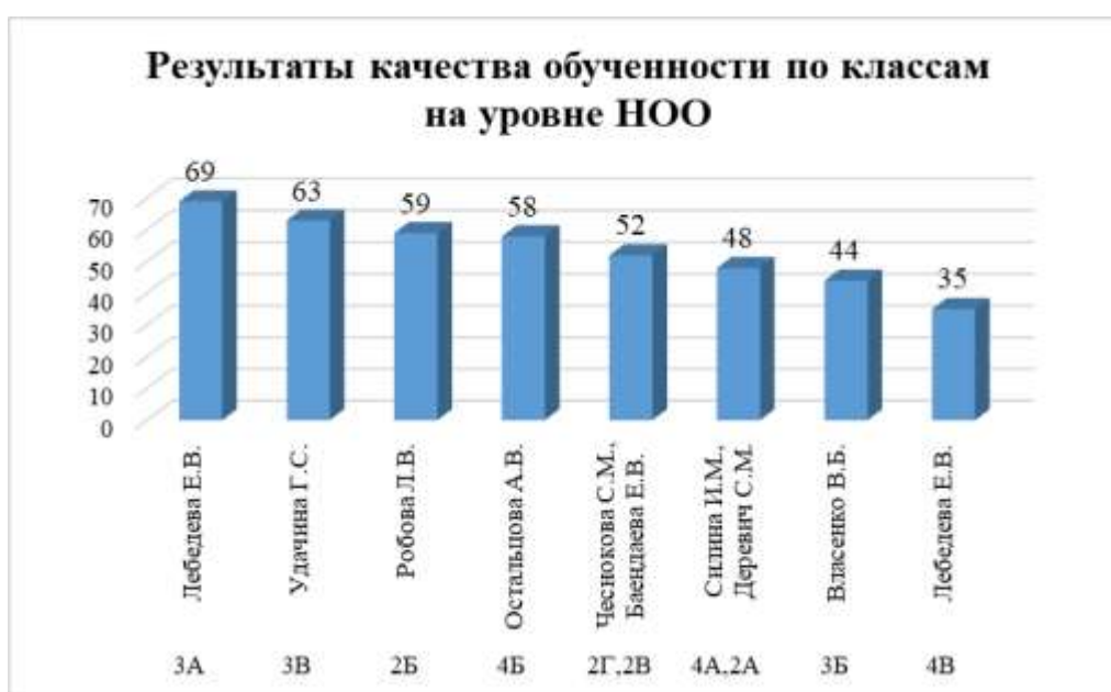
Рисунок 3. Показатели качества обученности по классам НОО

На уровне начального общего образования качество освоение основной образовательной программы в классах разное, от 69 % обучающихся (в 3А классе – кл.рук. Лебедева Е.В.), до 35% в (4В классе – кл.рук.Лебедева Е.В.) Данные в рейтинговой последовательности представлены в гистограмме (рис. 3).