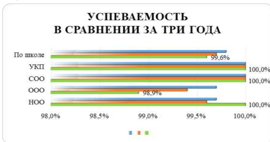
Рисунок 1. Сравнительный анализ успеваемости за три года

Для наглядности представим результаты в виде рисунков- гистограмм (рис.1, 2)