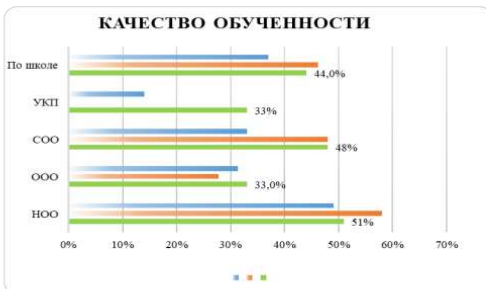
Рисунок 2. Сравнительный анализ качества обученности за три года

На уровне начального общего образования качество освоение основной образовательной программы в классах разное, от 69 % обучающихся (в 3А классе – кл.рук. Лебедева Е.В.), до 35% в (4В классе – кл.рук.Лебедева Е.В.) Данные в рейтинговой последовательности представлены в гистограмме (рис. 3).